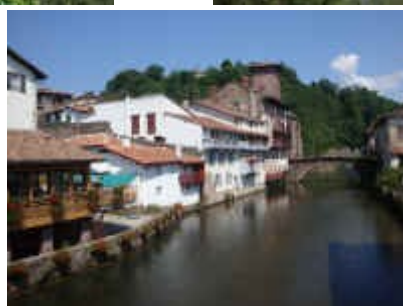
Le trou de Bozouls (BPF12), Ambialet (BPF81), St Jean Pied de Port (Dpt 64).

Pour les futurs candidats, le 14ème tour cyclo est déjà programmé en 2012. Les Alpes y seront franchies, pour les Pyrénées, ce sera 2014.