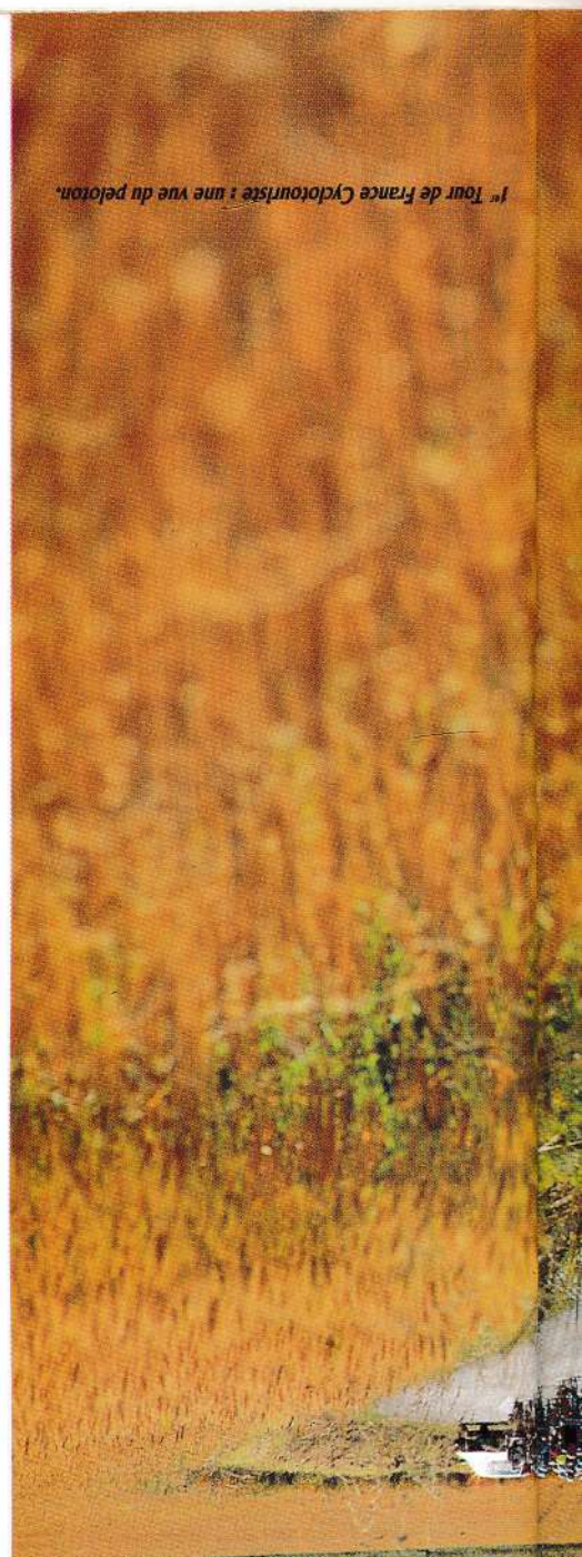
1 er Tour de France Cyclotouriste : une vue du peloton.