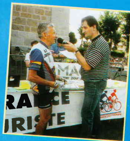
Le Tour de France Cyclotouriste bénéficie d'une médiatisation croissante.